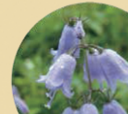
ツリガモニンジン 8月