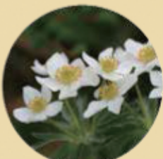
ハクサンイチゲ 6月

つつじ平のレンゲツツジ大群落は、国の天然記念物にも指定され、初夏6月下旬には湯ノ丸山の山肌を鮮やかな朱色の絨毯のように染め上げます。