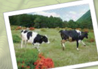
ツツジの間を追いかけっこ。ゆったり過ごす牛に癒されて♪