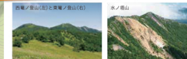
西電ノ登山(左)と東電ノ登山(右)