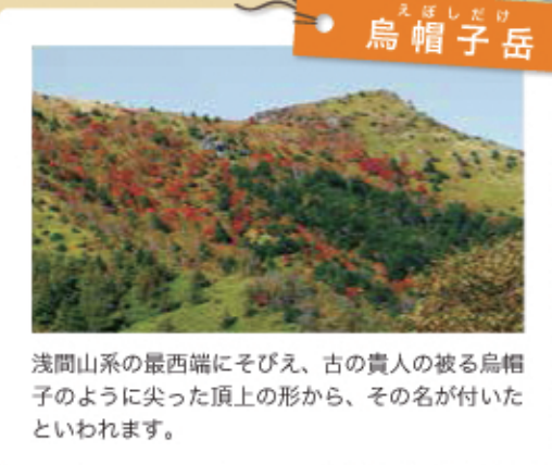
浅間山系の最西端にそびえ、古の賢人の被る烏帽子のように尖った頂上の形から、その名が付いたといわれます。