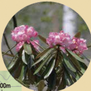
アズマシクナガ 6月